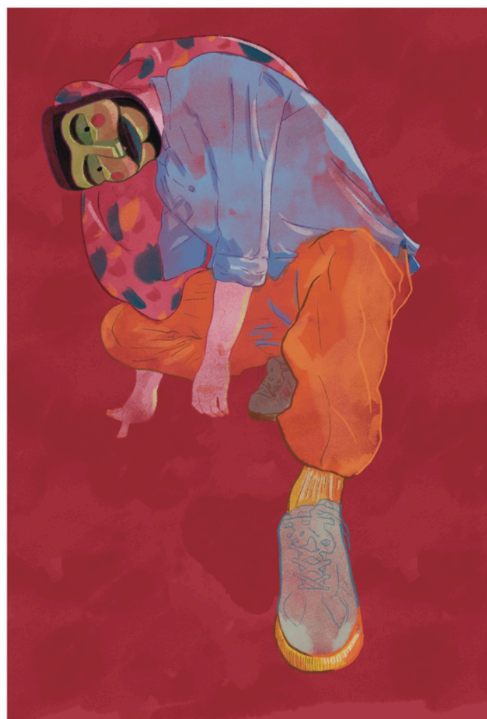
Título: Ciudadano II Impresión sobre couché 300 gr. Dimensiones: 320x500 mm