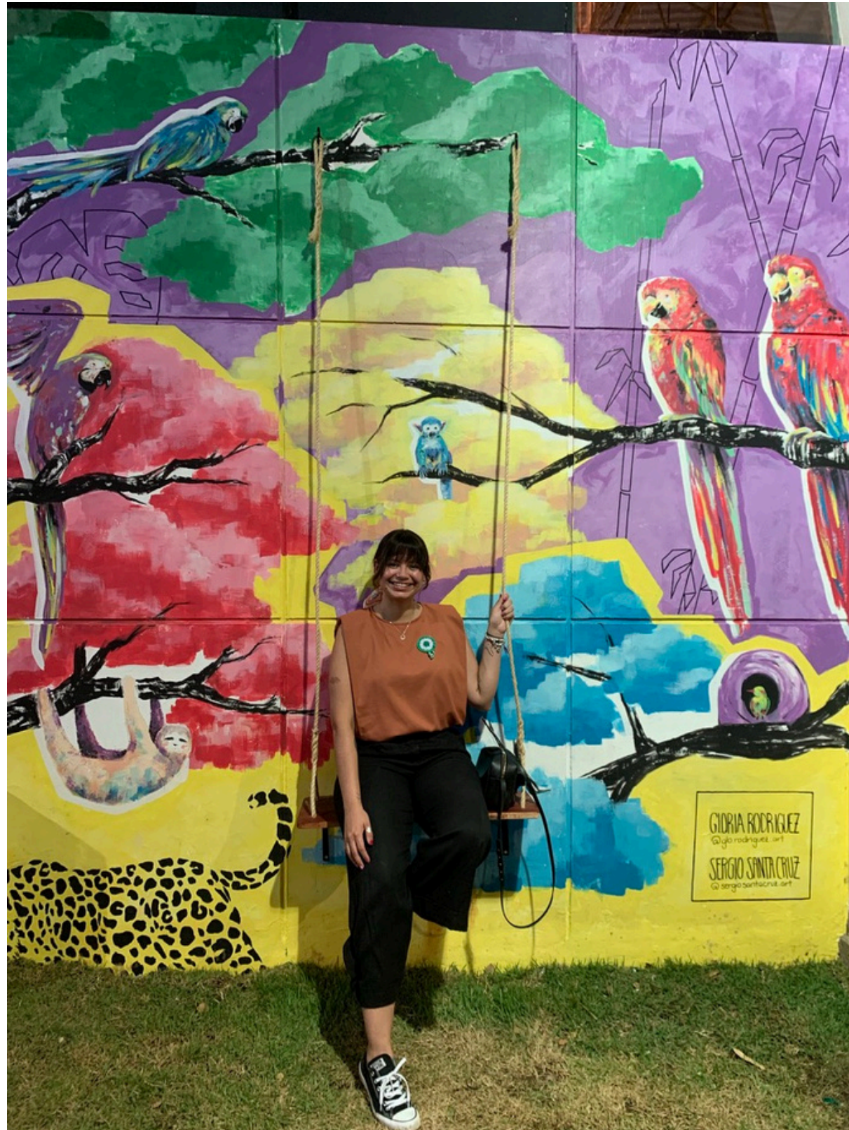
Mural 2021 Intervención con Sergio Santa Cruz Predios Feria Expocruz