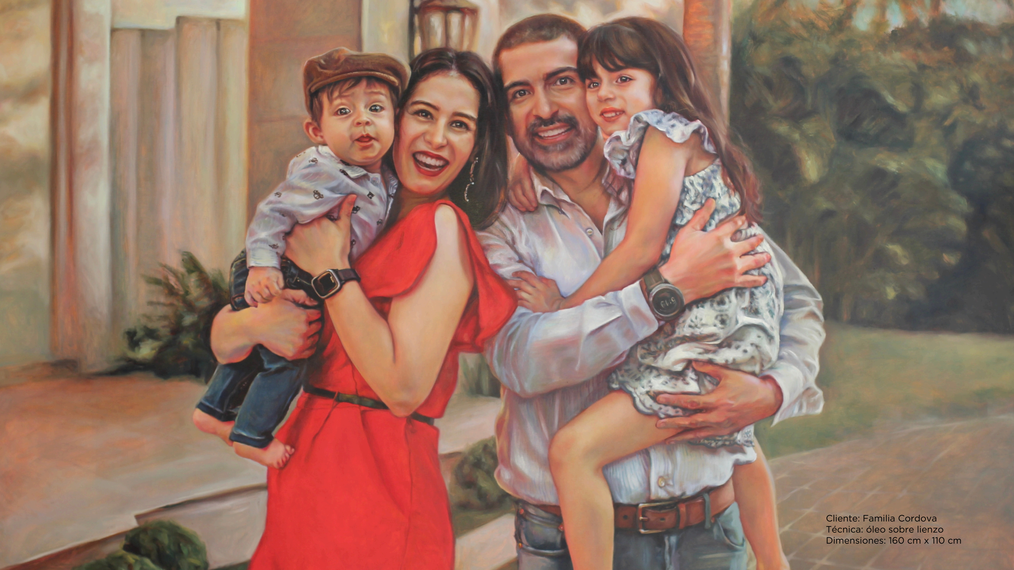
Cliente: Familia Cordova Técnica: óleo sobre lienzo Dimensiones: 160 cm x 110 cm