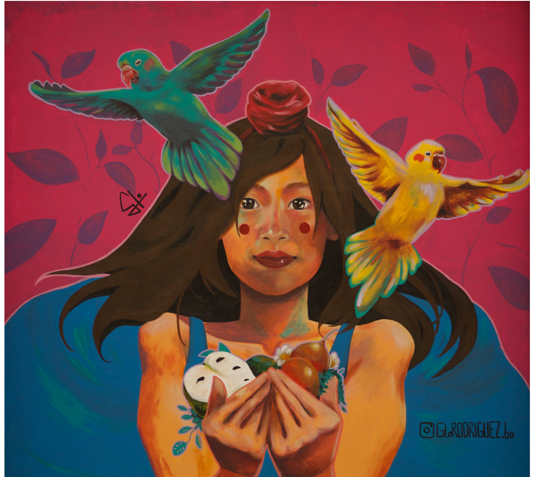
Mural 2022 Intervención en predios Feria Expocruz