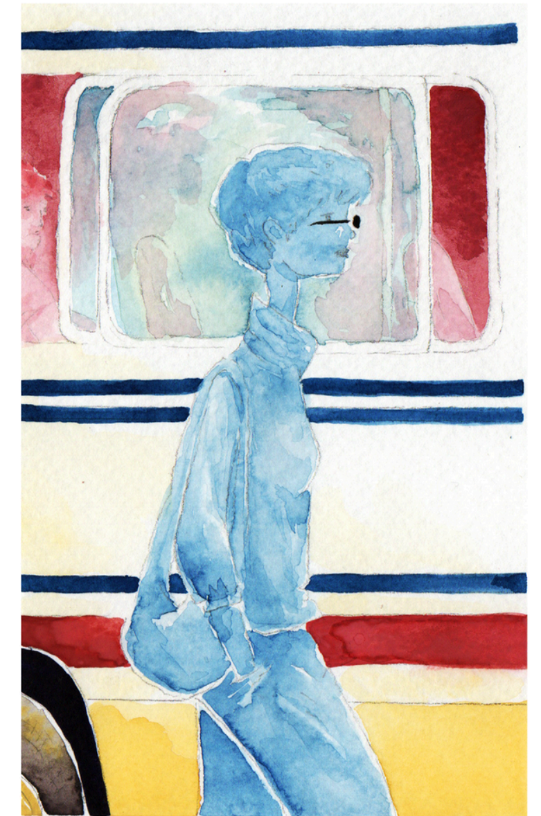
Título: En el centro Técnica: acuarelas Dimensiones: 10 cm x 15 cm