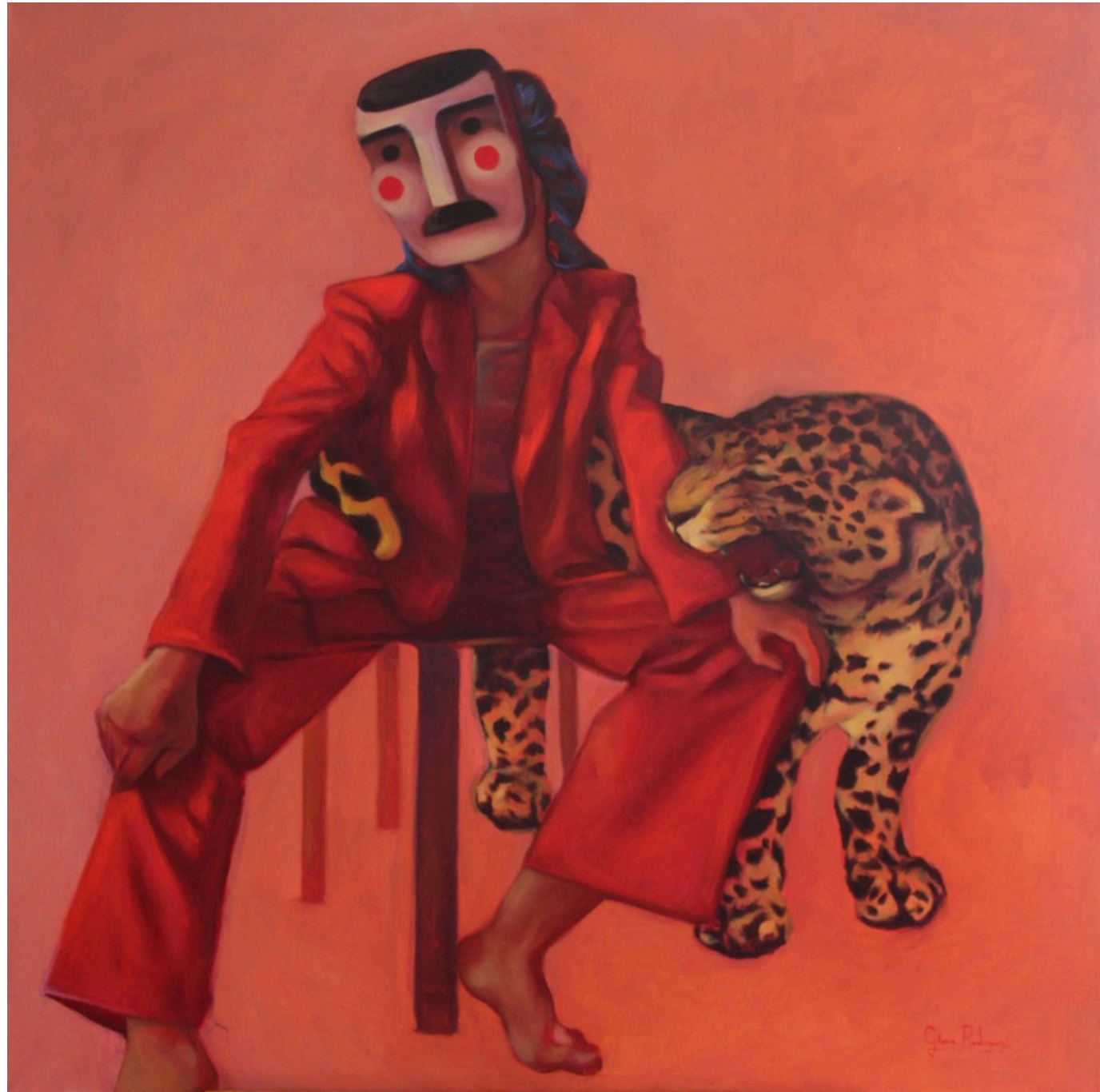
Título: Guardianes II Técnica: óleo sobre lienzo Dimensiones: 100 cm x 100 cm