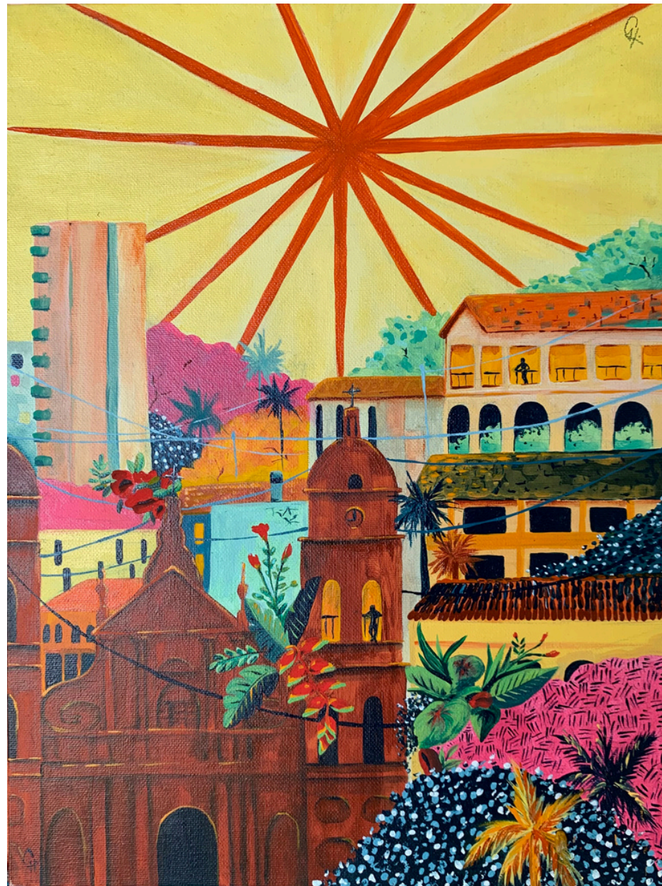
Título: Atardecer cruceño Técnica: acrílico sobre placa Dimensiones: 30 cm x 40 cm