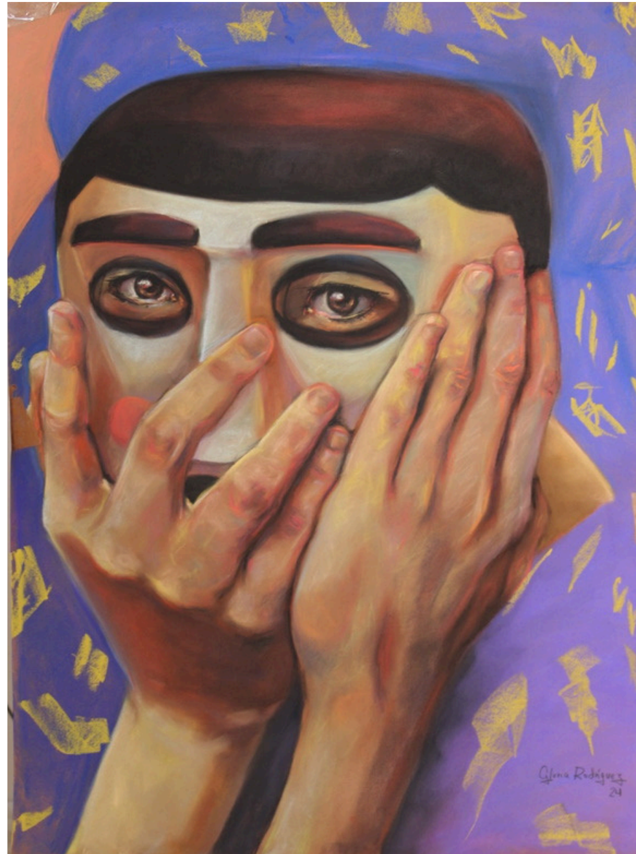
Título: Detrás de la máscara la identidad Técnica: tiza al pastel sobre cartulina Dimensiones: 80 cm x 60 cm