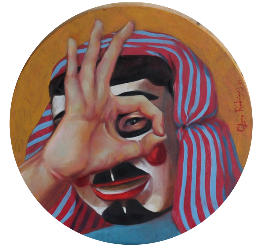
Título: Máscara II Técnica: óleo sobre lienzo Dimensiones: 30 cm diámetro