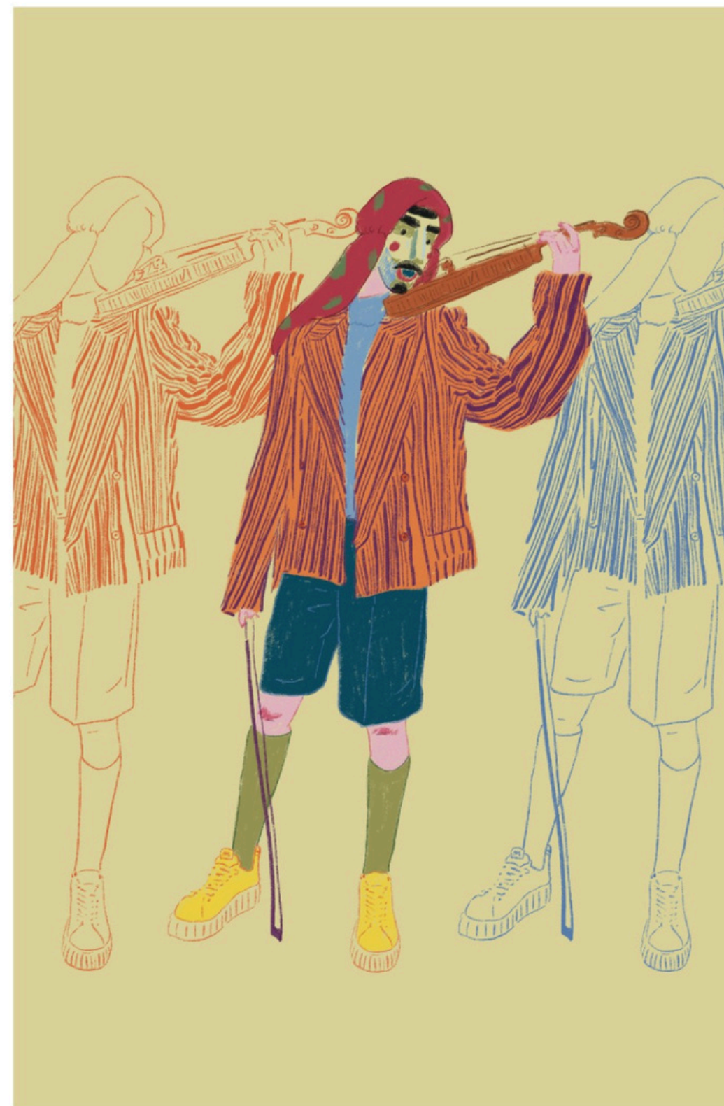
Título: El violinista Impresión sobre couché 300 gr. Dimensiones: 320x500 mm