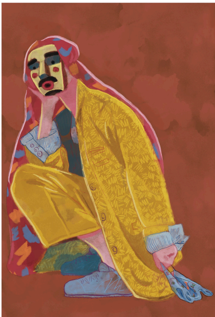
Título: Ciudadano III Impresión sobre couché 300 gr. Dimensiones: 320x500 mm